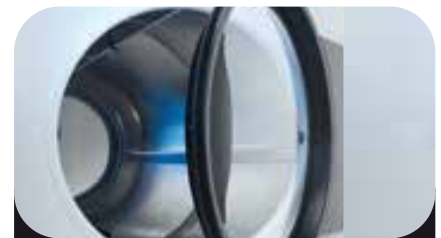
Puerta de Gran Tamaño