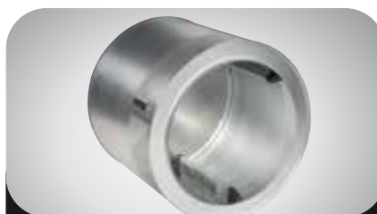
Tambor de Acero Galvanizado