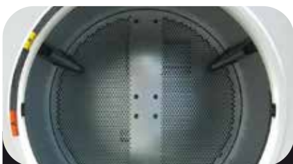
Amplia Capacidad de Carga